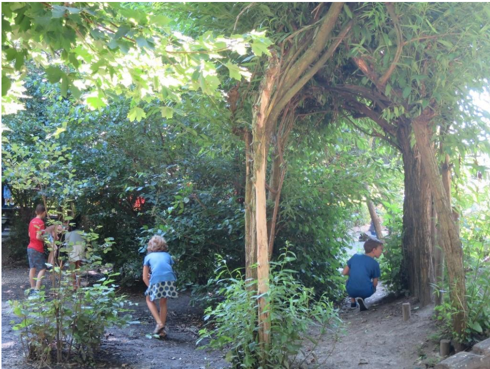
Foto: Groen schoolplein van OBS de Perroen in Maastricht - ontwerp en aanleg door CNME Maastricht en regio

kinderen - vooral jongens – na spelen op een groen schoolplein dan na spelen op een grijs schoolplein. Kinderen worden veezer op een groen schoolplein, maar dit vonden ouders geen probleem. Groene schoolpleinen worden hoger gewaardeerd door leerlingen, ouders en leerkrachten en bieden tevens meer kansen voor klimaatadaptatie. Kosten voor aanleg en onderhoud van een groen schoolplein liggen hoger dan bij een grijs schoolplein. 80% van de kinderen vindt buitenlessen - op groene en grijze schoolpleinen - leuk. Pedagogisch medewerkers en leerkrachten ervaren vaak nog belemmeringen om het schoolplein educatief te gebruiken. Deze belemmeringen zijn te overkomen met tips en ervaring. Concluderend kunnen we zegen dat er voor kinderen vooral positieve effecten van groene schoolpleinen zijn; voor scholen hogere kosten en voor leerkrachten kansen.